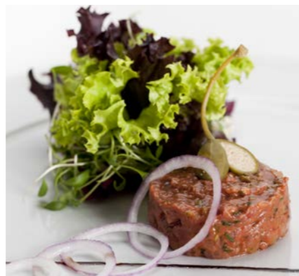
Tatar Festival Juni bis Mitte September

Begehrter Begleiter: die köstliche Morchel.