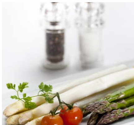
Spargel- und Morchelzeit Mitte März bis Ende Mai

Zudem setzen wir saisonale Höhepunkte. Über das Jahr verteilt erleben Sie Gourmet-Festivals der besonderen Art.