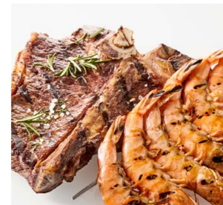
Surf & Turf Anfang Januar bis Mitte März

Es ist der exquisiteste Pilz, den es gibt. Den schwarzen und weissen Trüffel servieren wir Ihnen mit feinsten Gerichten.