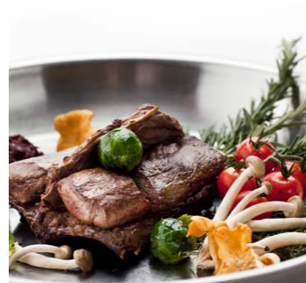
Wildzeit Mitte September bis Mitte November

Jede Kreation besticht durch Einzigartigkeit und kulinarische Kreativität.