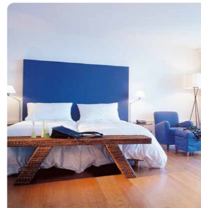
Asian Rooftop Suite