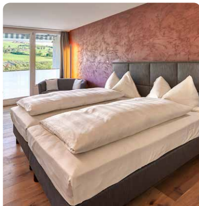
Classic Single Rooms