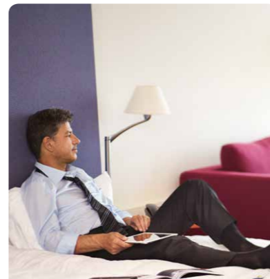
Asian Junior Suite