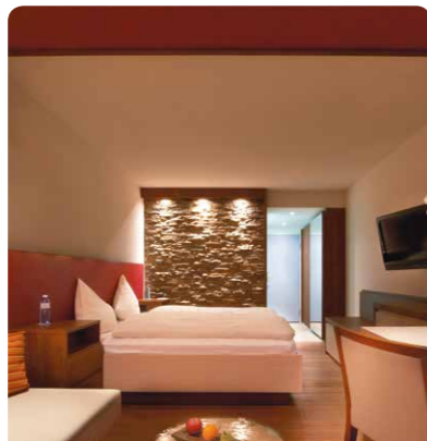
Superior Chic Rooms